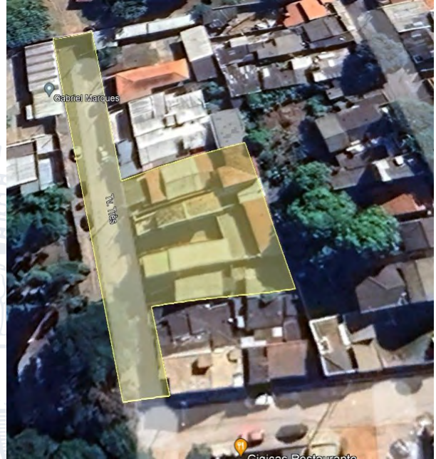
Imagem 1 – Imagem de Satélite do Parcelamento Travessa Irma de Castro Rocha