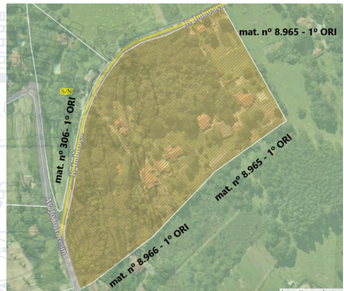
Imagem 1 – Imagem de Satélite do Desmembramento em nome do Espólio de Aparecida Penteado Pires da Silveira