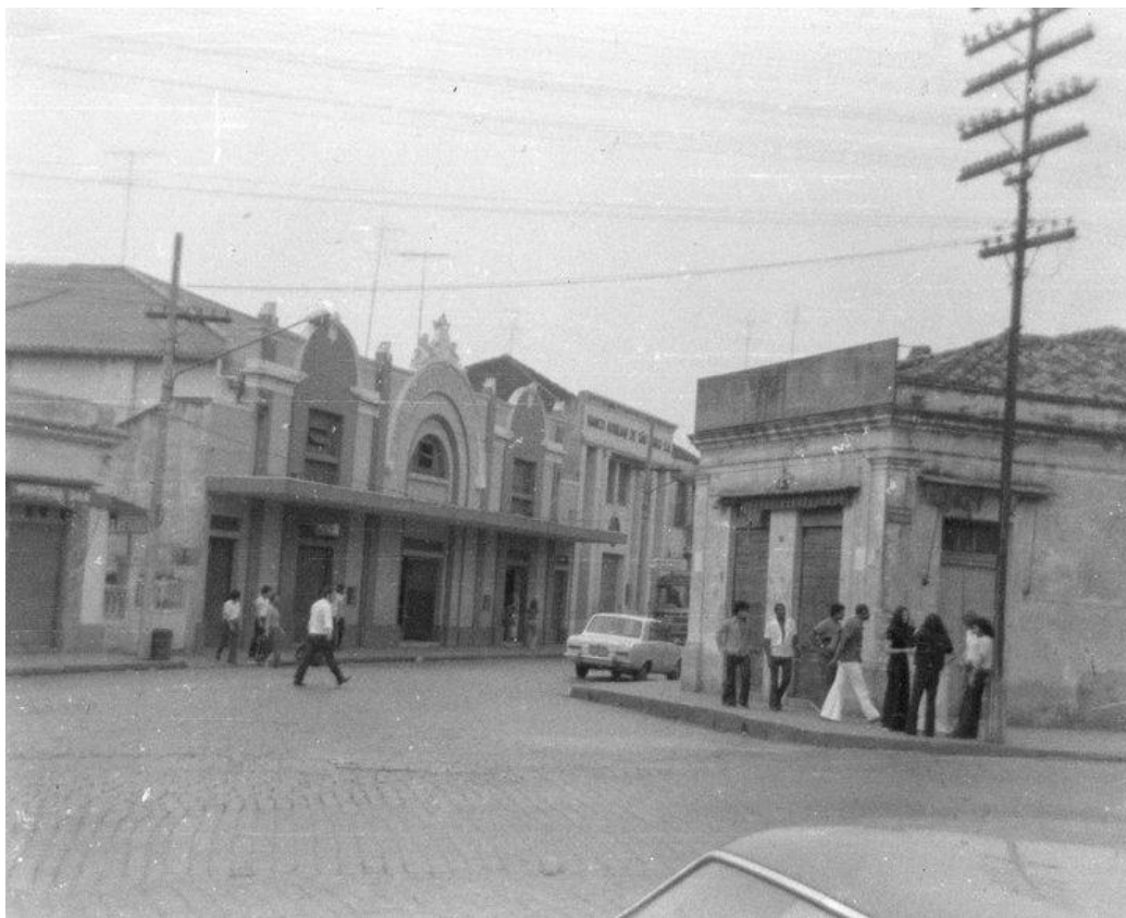
Fotografia 11 – Rua Barão de Jundiá x Rua Engenheiro Monlevade – Centro