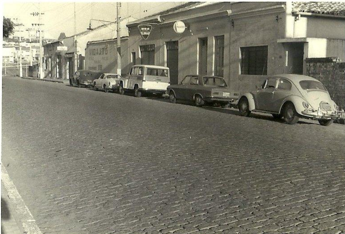
Fotografia 18 – Rua Torres Neves x Rua Vigário J. J. Rodrigues – Centro