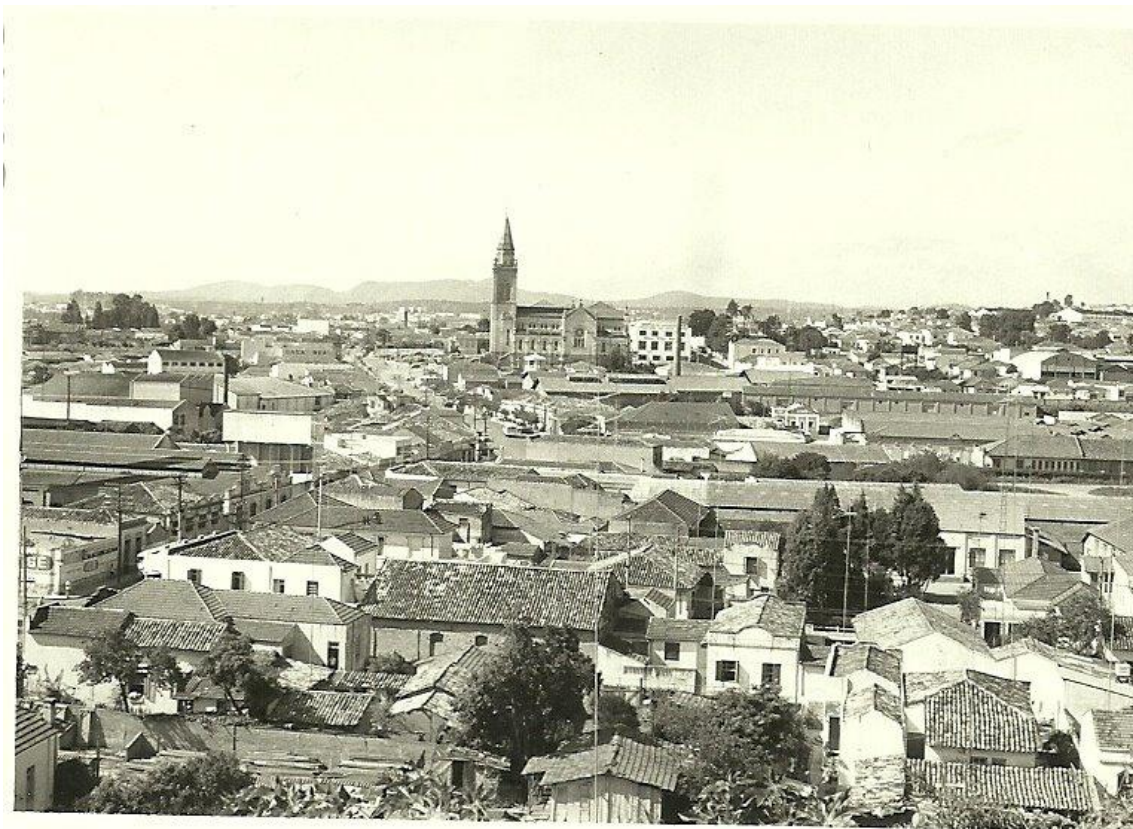
Fotografia 2 – Rua Senador Fonseca x Rua Bernardino de Campos (sentido Centro)