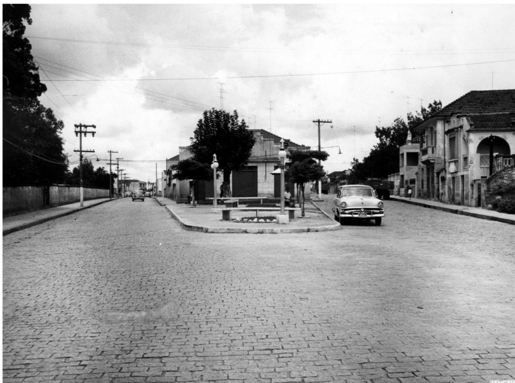
Fotografia 15 – Início da Rua Barão de Jundiá – próximo ao Teatro Polytheama